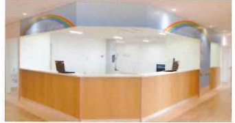
【スタッフステーション】

●製品の定格およびデザインは改善等のため予告なく変更する場合があります ●製品の色は印刷物ですので実際の色と若干異なる場合があります