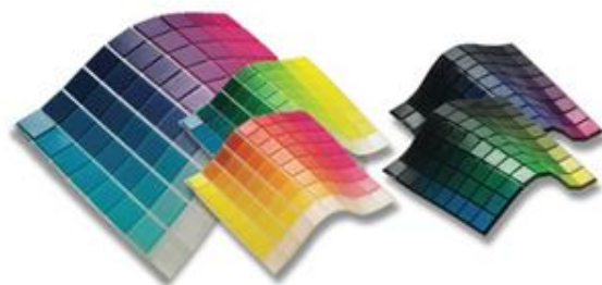
材料を混合することで硬さ(シヨア)を変更することも可能