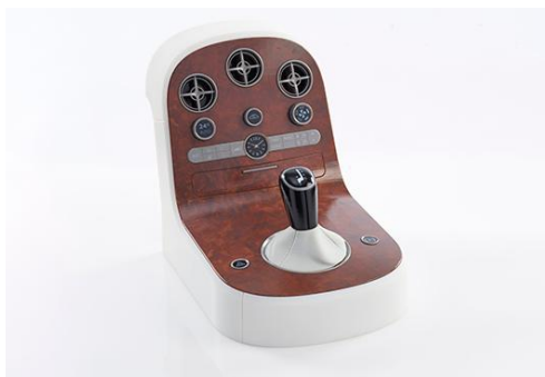
フルカラーにて木目の再現も可能

ヤマセグループではそのような限界を打破するため、より精度と拡張性を高めたマルチマテリアル&フルカラー対応の3Dプリンタを導入いたしました。